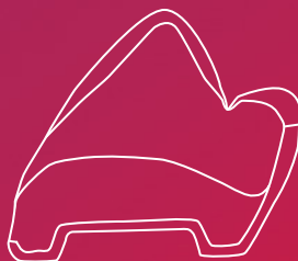
Lateral view – BonSelect TCR