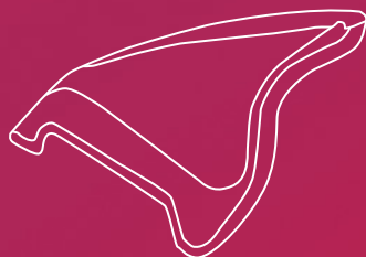
Lateral view – PhysioSelect TCR